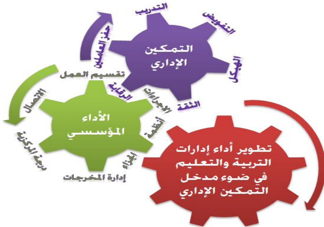
الشكل (1) مجالات التصور المقترح لتطوير أداء إدارات التربية والتعليم في ضوء مدخل التمكين الإداري

بناءً على النتائج التي توصل إليها البحث الحالي؛ في الدراستين النظرية والميدانية التي شكلت جميعها خلفية لبناء التصور المقترح، كما ساعدت على بلورته بما يتناسب مع ظروف وطبيعة الإدارات التعليمية بالجمهورية اليمنية، وفي ظل فلسفة مفهوم التمكين الإداري التي تم طرحها ومناقشتها، تم اقتراح مجالات ومحاور التصور المقترح لتطوير أداء إدارات التربية والتعليم بالجمهورية اليمنية في ضوء مدخل التمكين الإداري؛ لما يمكن تطبيقه خلال العشر السنوات القادمة، والمتمثل في الشكل الآتي: