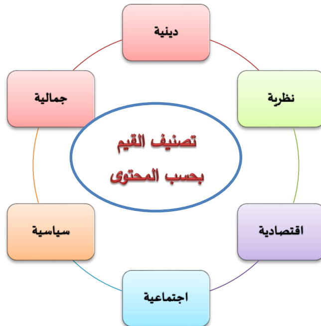
شكل (1) تصنيف القيم بحسب محتواها، المصدر من تصميم الباحثة بالاعتماد على (عوض، 2008)