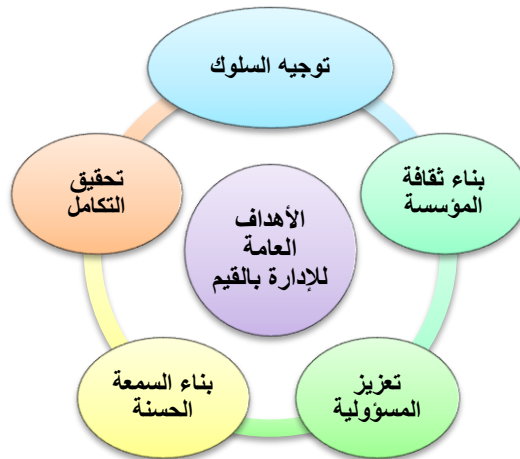
شكل (3) الأهداف العامة للإدارة بالقيم

تتعلق أهداف الإدارة بالقيم بتوجيه السلوك واتخاذ القرارات في أي مؤسسة بناءً على قيمها المحددة، وتحدد أهداف الإدارة بالقيم وفقاً لرؤية ورسالة وقيم المؤسسة وأهدافها الاستراتيجية، وترى الباحثة أنه يمكن التعرف على بعض الأهداف العامة للإدارة بالقيم؛ وكما يبينها الشكل (3):